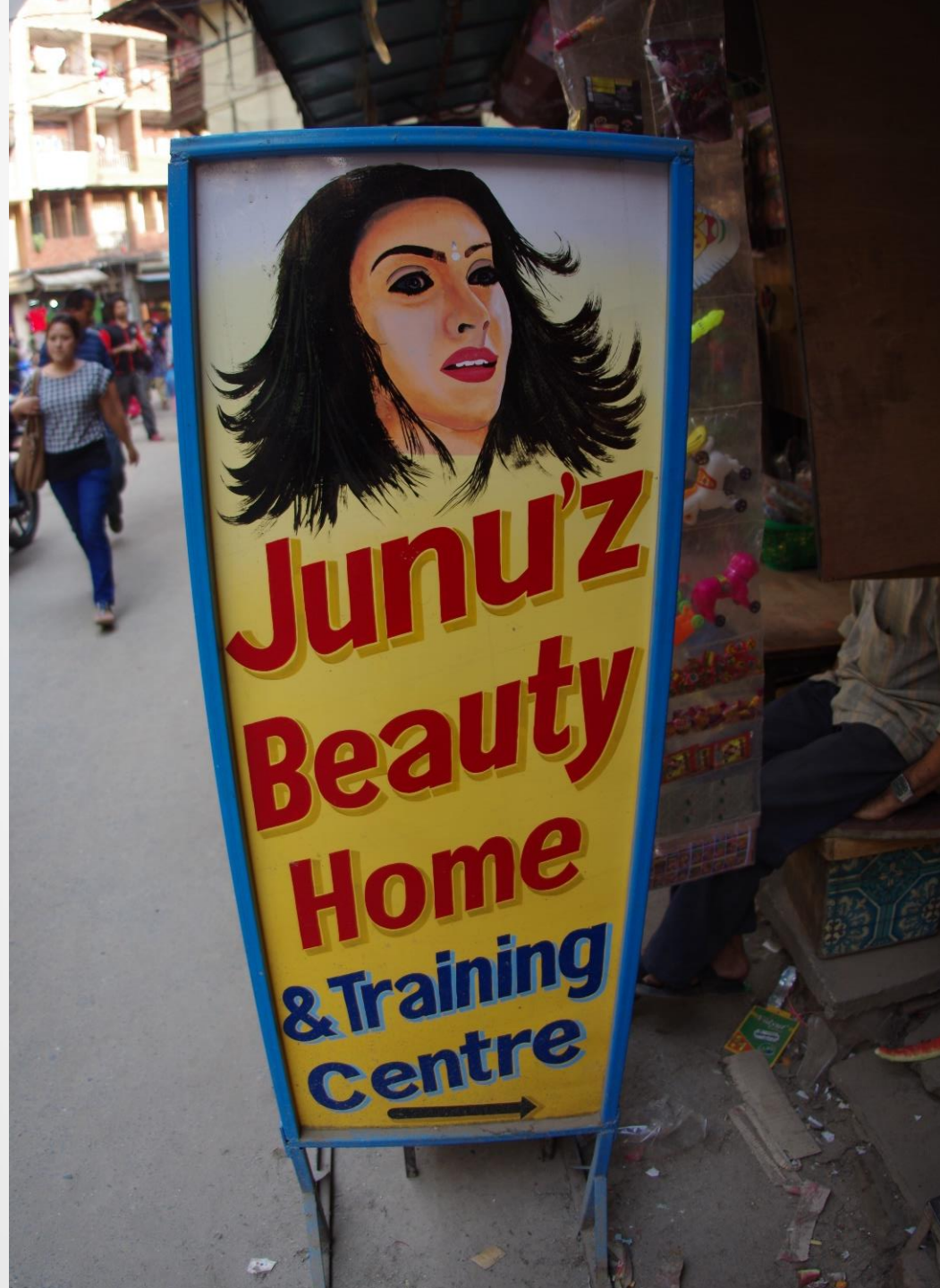
町の美容室の看板。