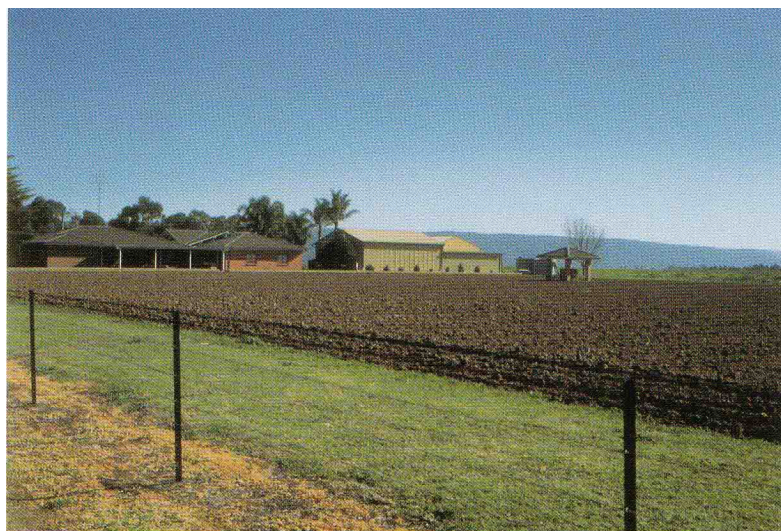
写真 3 ペンリス市キャスルレイ地区におけるホビーファーム。

軽種馬飼養農場では10頭から20頭のサラブレッドが飼養され、それらの販売で得られる年収は酪農場や園芸農場の2倍から3倍に達している。さらに、農場では20頭から40頭の乗馬用馬とポニーが放牧されており、週末には都市住民が乗馬を楽しんでいる。