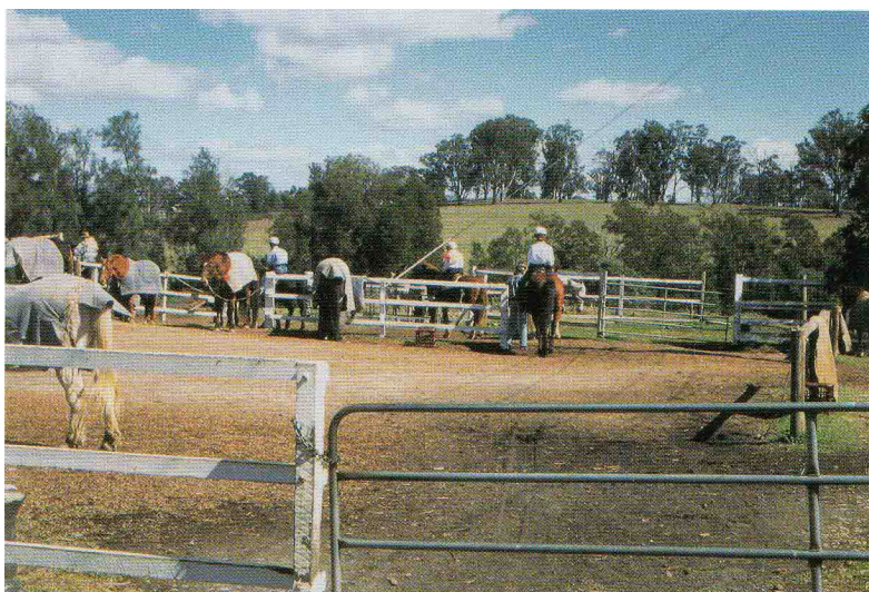
写真 2 ペンリス市キャスルレイ地区における軽種馬飼養農場。

酪農場が7つ立地し、それらの規模は70 ha から100 ha で、それぞれ夫婦2人で経営されている。また、酪農場はそれぞれ100頭から120頭の搾乳牛を輪換放牧し、生産割当制度に基づいて市乳生産を行っている。